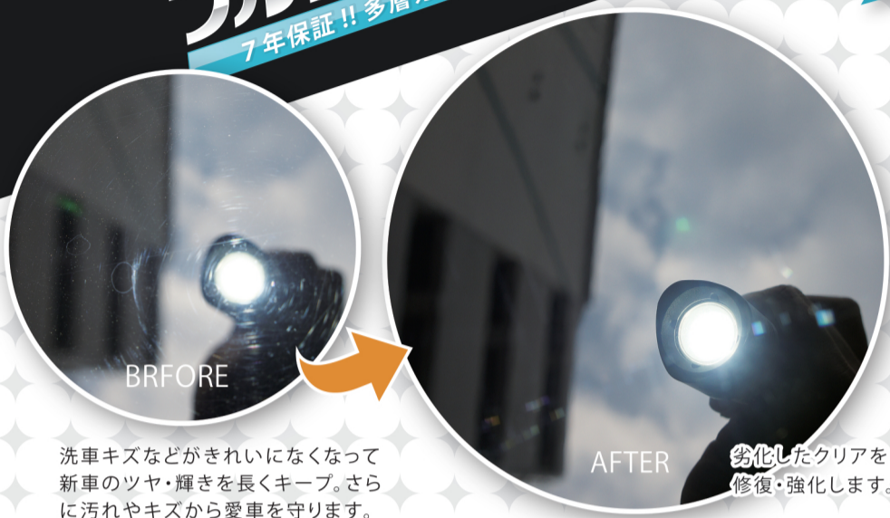
洗車キズなどがきれいになくなって新車のツヤ・輝きを長くキープ。さらに汚れやキズから愛車を守ります。