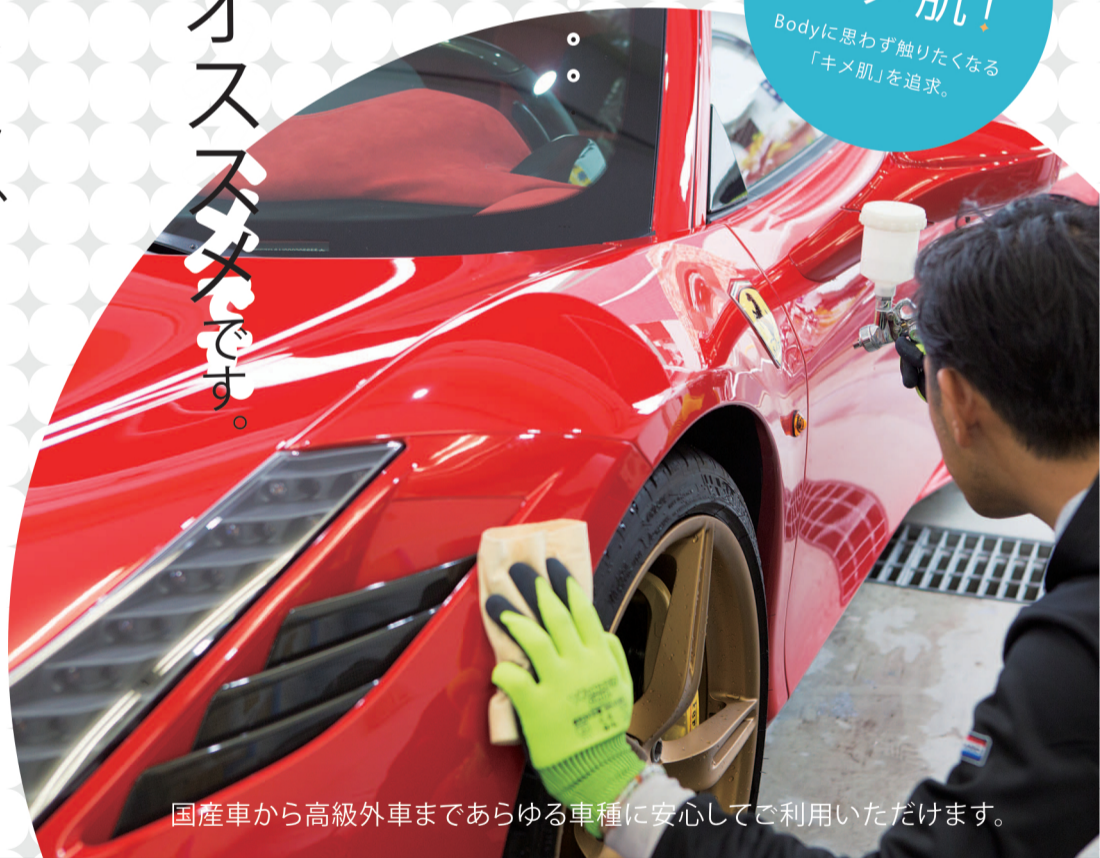
国産車から高級外車まであらゆる車種に安心してご利用いただけます。

でも、コーティングしたけど1年でダメになった。そんな方もご安心ください。ウルトラケアのガラスコーティングと、従来のコーティングの質の違いは、触れば実感いただけます。自信があるから安心の7年保証です。さらに、匠磨き、鉄粉取り、虫取りが含まれるからお得です。